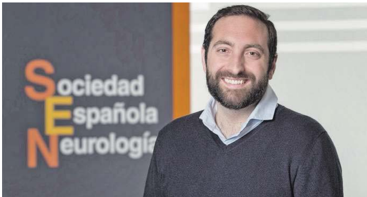
El especialista es el responsable del área de Comunicación de la SEN, desde donde realizan campañas de prevención que son fundamentales.

Precisamente, el desarrollo de estrategias de comunicación centradas en la prevención de estas enfermedades es uno de los retos de este año. «Lo fundamental hoy es mandar mensajes de prevención, llegar antes para evitar su desarrollo», explica el doctor. Porque es posible retrasarlas o frenarlas: «Muchas de las dolencias que se manifiestan en la tercera edad, como las neuro-