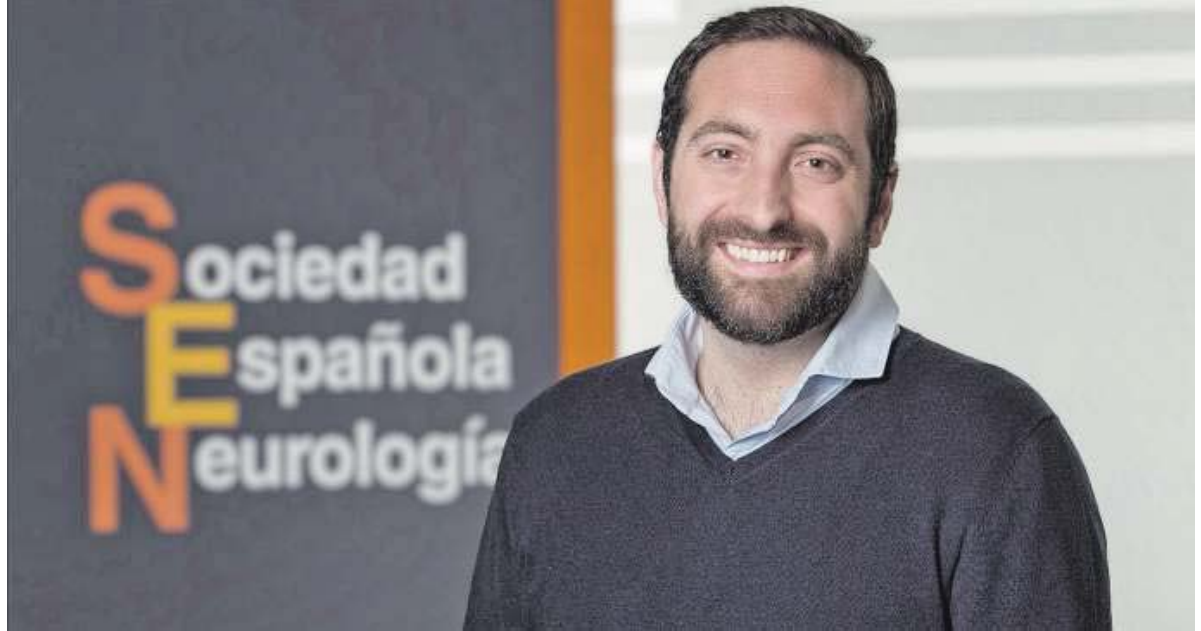
El especialista es el responsable del área de Comunicación de la SEN, desde donde realizan campañas de prevención que son fundamentales.

Precisamente, el desarrollo de estrategias de comunicación centradas en la prevención de estas enfermedades es uno de los retos de este año. «Lo fundamental hoy es mandar mensajes de prevención, llegar antes para evitar su desarrollo», explica el doctor. Porque es posible retrasarlas o frenarlas: «Muchas de las dolencias que se manifiestan en la tercera edad, como las neuro-