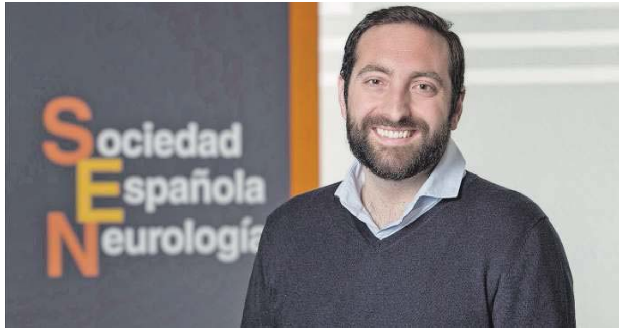
El especialista es el responsable del área de Comunicación de la SEN, desde donde realizan campañas de prevención que son fundamentales.

Precisamente, el desarrollo de estrategias de comunicación centradas en la prevención de estas enfermedades es uno de los retos de este año. «Lo fundamental hoy es mandar mensajes de prevención, llegar antes para evitar su desarrollo», explica el doctor. Porque es posible retrasarlas o frenarlas: «Muchas de las dolencias que se manifiestan en la tercera edad, como las neuro-