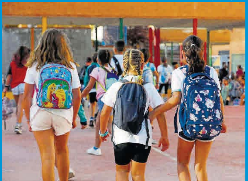
Un grupo de niñas a su llegada al colegio.

Por otro lado, resalta que existen otros factores que pueden precipitar una crisis, como los alimentarios: saltarse comidas o llevar ayuno prolongado es un disparador frecuente; asimismo, determinados alimentos pueden provocarla en personas susceptibles. El especialista destaca el cho-