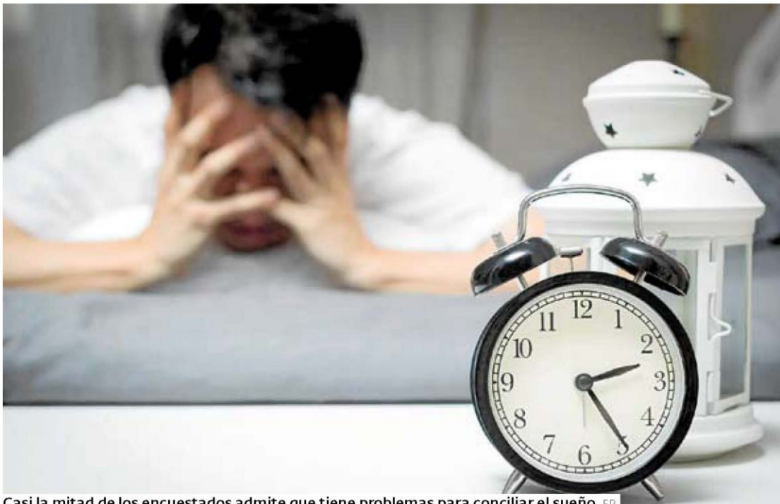
Casi la mitad de los encuestados admite que tiene problemas para conciliar el sueño.

Otra conclusión del estudio es que el cannabis también se usa para dormir. El 8 por ciento de los encuestados lo consume al menos una vez al mes y, de ellos, el 63 por ciento lo utiliza para descansar, porcentaje que sube al 73 cuando se trata de la franja de edad más mayor, de 30 a 34 años.