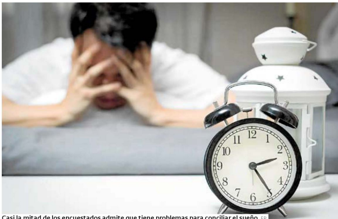
Casi la mitad de los encuestados admite que tiene problemas para conciliar el sueño.

Otra conclusión del estudio es que el cannabis también se usa para dormir. El 8 por ciento de los encuestados lo consume al menos una vez al mes y, de ellos, el 63 por ciento lo utiliza para descansar, porcentaje que sube al 73 cuando se trata de la franja de edad más mayor, de 30 a 34 años.