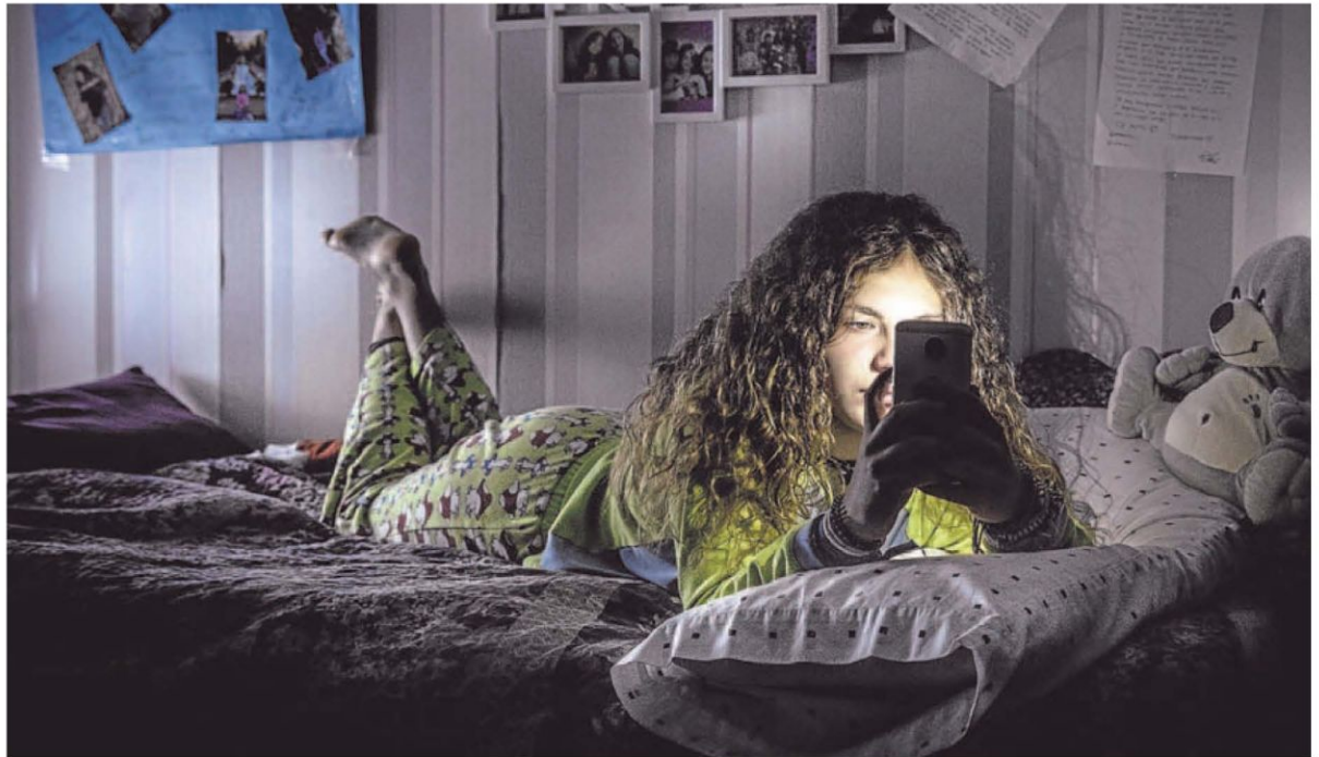
Una adolescente interactúa con el teléfono móvil mientras está en la cama. IÑAKI ANDRÉS

En esta edad se aconseja dormir de 7 a 9 horas y evitar café, drogas, alcohol y cenas pesadas